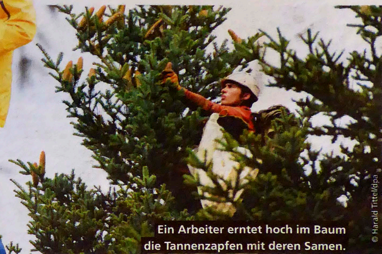
Ein Arbeiter erntet hoch im Baum die Tannenzapfen mit deren Samen.

Sie kaufen die kleinen Bäume von der Baumschule. Die Pflanze ist jetzt ge-